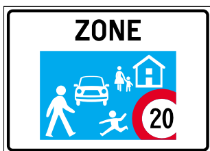
2.59.5 Zone de rencontre (art. 2a et 22b)