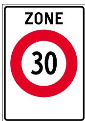
2.59.1 Signal de zone (p. ex. zone 30) (art. 2a et 22a)