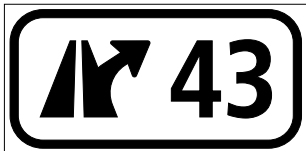
4.59 Plaque numérotée pour jonctions (art. 56)