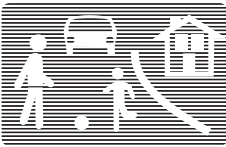
E, 17 a

Accès interdit aux véhicules transportant plus d'une certaine quantité de produits de nature à polluer les eaux.