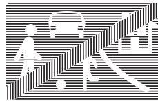
E, 17 b