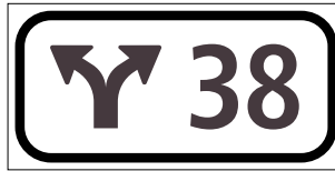
4.59.1 Nummerntafel für Verzweigungen (Art. 56)