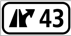
4.59 Nummerntafel für Anschlüsse (Art. 56)