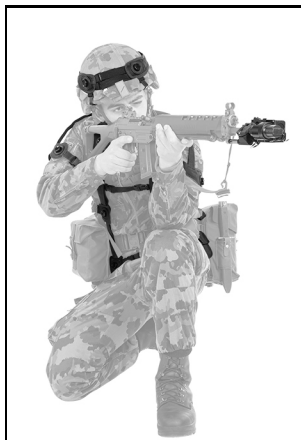
Schiesssimulator zum Sturmgewehr 90 Neue Technologie