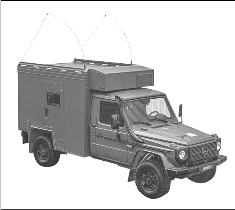
Fachsystemfahrzeug am Beispiel RAP 4 -Wagen

weise Übermittlungsgeräten, Computeranlagen oder globalem Positionierungssystem (GPS). Als neues Grundfahrzeug dient der Mercedes-Benz G 300 CDI 4×4.