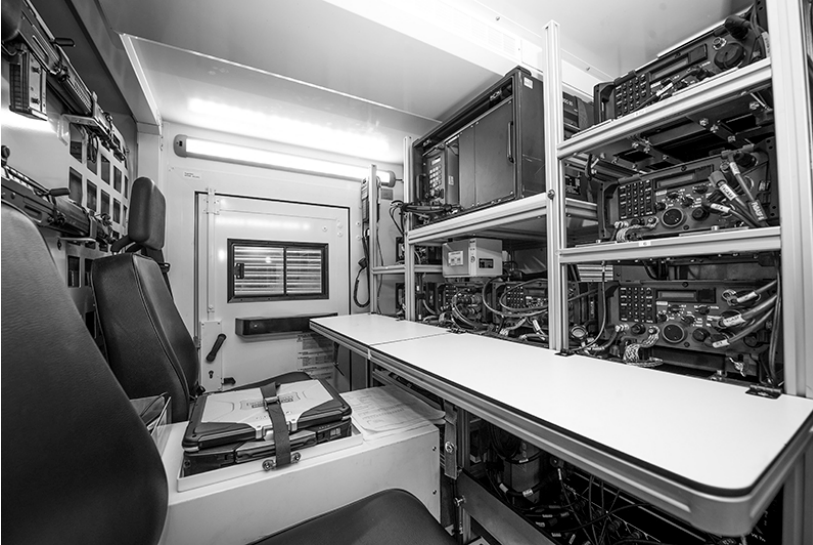
Innenansicht eines Fachsystemfahrzeugs

Das Grundfahrzeug basiert auf dem Konzept des mit dem RP 2014 bewilligten Stationswagens Mercedes-Benz G 300 CDI 4x4. Auf das Grundfahrzeug wird mit Ausnahme der Relaisfahrzeuge SE-235/M2 ein Kastenaufbau montiert, der die Bedienmannschaft und das jeweilige Fachsystem aufnimmt. Dieses besteht aus fix eingebauten Geräten und dem dazu notwendigen Betriebsmaterial, die von den alten Steyr-Daimler-Puch 230 GE-Fahrzeugen übernommen und in die neuen Fahrzeuge eingebaut werden.