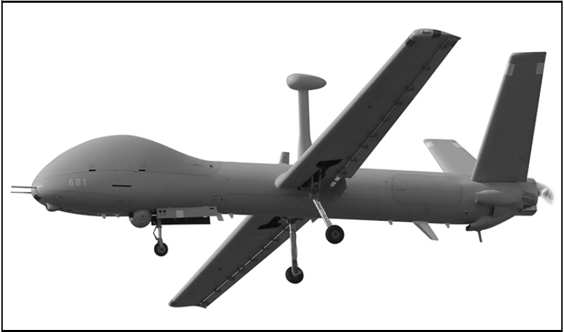
Hermes 900 HFE – Aufklärungsdrohnensystem 15 (ADS 15)

Das ADS 15 weist im Vergleich zum ADS 95 eine grössere Reichweite, eine längere Verweildauer im Einsatzraum und eine bessere Allwettertauglichkeit auf. Die neue Drohne kann von einem Standort starten und über der gesamten Schweiz – insbesondere auch bei schlechtem Wetter jenseits des Alpenkamms – eingesetzt werden. Dies steigert die Flexibilität im Einsatz.