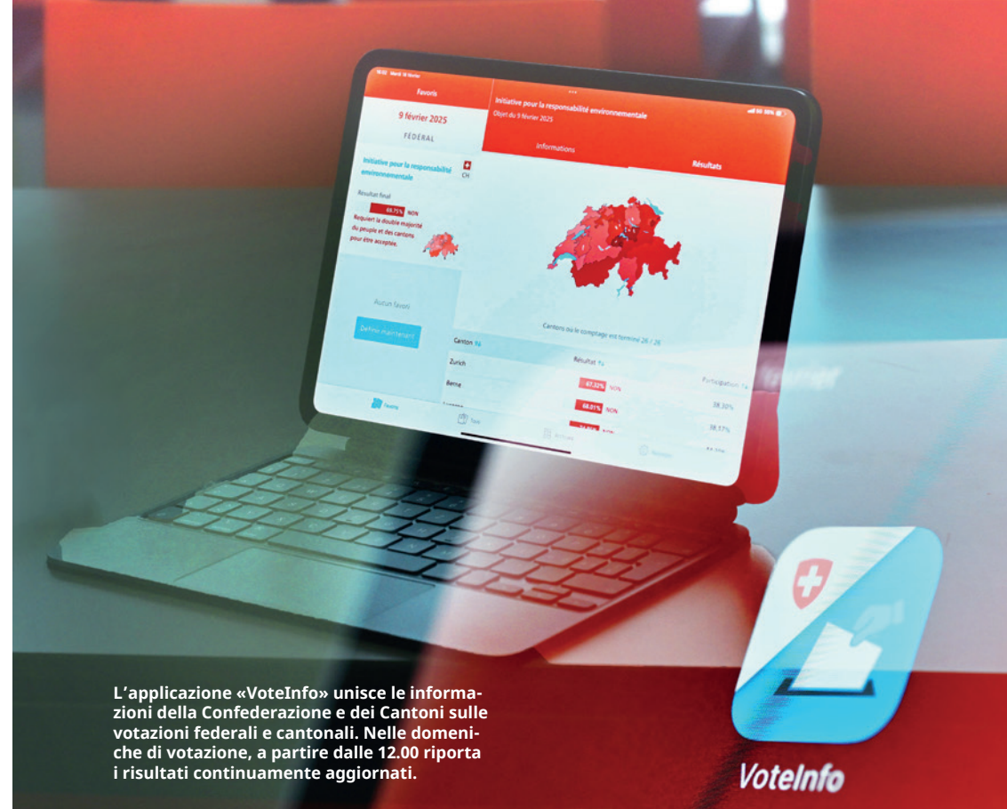
L'applicazione «VoteInfo» unisce le informazioni della Confederazione e dei Cantoni sulle votazioni federali e cantonali. Nelle domeniche di votazione, a partire dalle 12.00 riporta i risultati continuamente aggiornati.

Gli aventi diritto di voto devono poter individuare da dove proviene un'informazione, ragion per cui la fonte va sempre indicata. L'autorità non può trasmettere informazioni senza specificarne la natura ufficiale né facendo credere che provengano da un privato. La documentazione concernente una votazione (p. es. rapporti) che viene messa a disposizione di terzi deve essere parimenti consultabile da parte di tutte le persone e organizzazioni interessate.