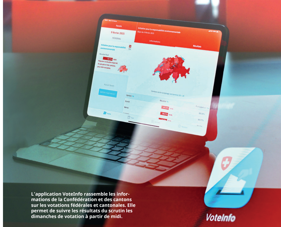
L'application VoteInfo rassemble les informations de la Confédération et des cantons sur les votations fédérales et cantonales. Elle permet de suivre les résultats du scrutin les dimanches de votation à partir de midi.

à l'origine d'une information. Une prise de position officielle ne doit jamais apparaître comme étant l'opinion de milieux privés. Si des documents relatifs à une votation (par exemple des textes d'exposés) sont fournis à des tiers, ils doivent être mis à disposition de toutes les personnes et organisations intéressées.